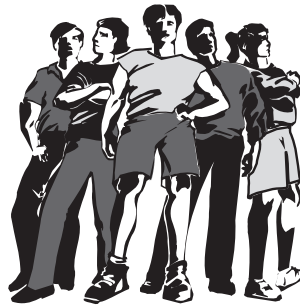
Une histoire inventée

L'adolescence est une période de transition vers le monde des adultes qui se vit différemment selon les cultures.